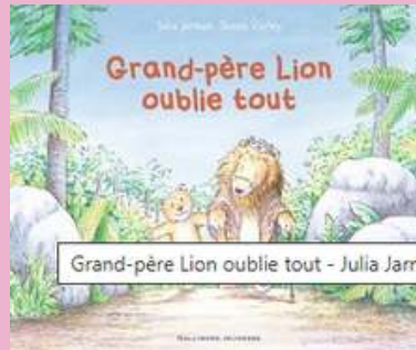
GRAND-PÈRE LION OUBLIE TOUT de Julia JARMAN

Pour évoquer la perte d'un être cher avec les plus jeunes, de façon claire et simple