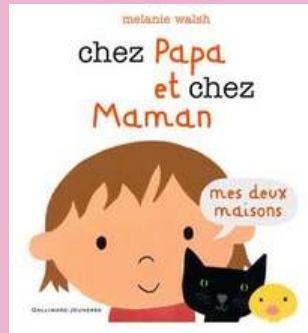
CHEZ PAPA ET CHEZ MAMAN : MES DEUX MAISONS de Mélanie WALSH

Une histoire simple et juste qui, à travers l'affection qui unit petits-enfants et grands-parents, évoque les difficultés de l'âge, telle que la maladie d'Alzheimer