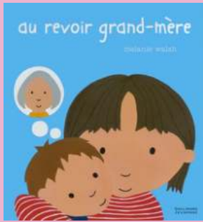
AU REVOIR GRAND-MÈRE de Mélanie WALSH

Pour évoquer la perte d'un être cher avec les plus jeunes, de façon claire et simple