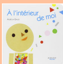
A L'INTERIEUR DE MOI d'Aurélia Gaud

Emo est un petit personnage en proie à toutes sortes d'émotions : des airs de fêtes qui font tourner la tête, des bruits d'orage qui rendent fou de rage, des petits riens qui remplissent de chagrin... Pour les tout-petits, un livre d'éveil sensible et artistique qui joue avec le pouvoir évocateur des couleurs et des formes.